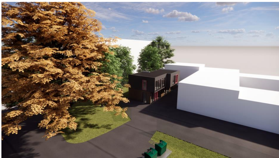
Pav. 4 Modulinio biuro projektinė vizualizacija

UAB „Kėdainių butai“ 2025 m. pasirengė projektą moduliniam administraciniam biurui įrengti Smilgos g. 1A. Projektas būtų įgyvendintas tik pardavus nekilnojamą turtą Smilgos g. 9 ir Didžioji g. 22A. Bendrovė siekia optimizuoti sąnaudas taip pat dalį lėšų skirti veiklos stiprinimui ir kokybės gerinimui. Žemiau pateikiama projekto vizualizacija.