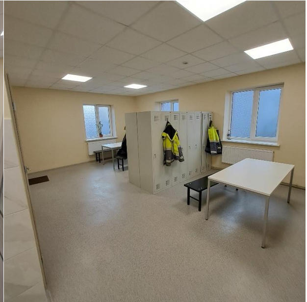
2 pav. Patalpos prieš remontą