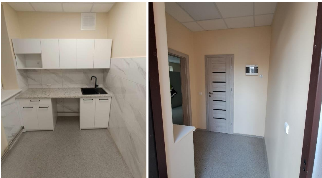
1 pav. Patalpos po remonto

Bendrovė panaudojo 27728 Eur apyvartinių lėšų patalpų atnaujinimui (įskaitant baldus ir kitą inventorių), esančių Smilgos g. 1A. Buvo atnaujinta darbuotojų persirengimo-poilsio patalpa, kartu su WC, dušu ir virtuvele.