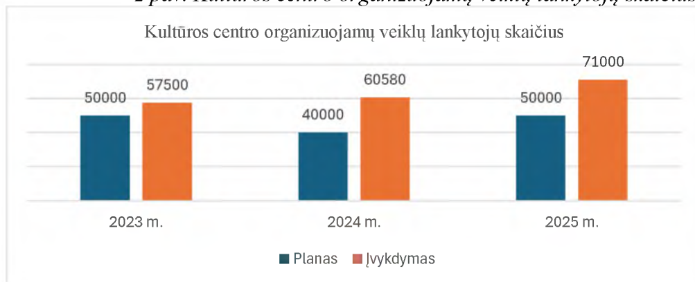
2 pav. Kultūros centro organizuojamų veiklų lankytojų skaičius.

Priemonės vertinimo kriterijus – Kultūros centro organizuojamų veiklų lankytojų skaičius, kurio reikšmė – 71 000.