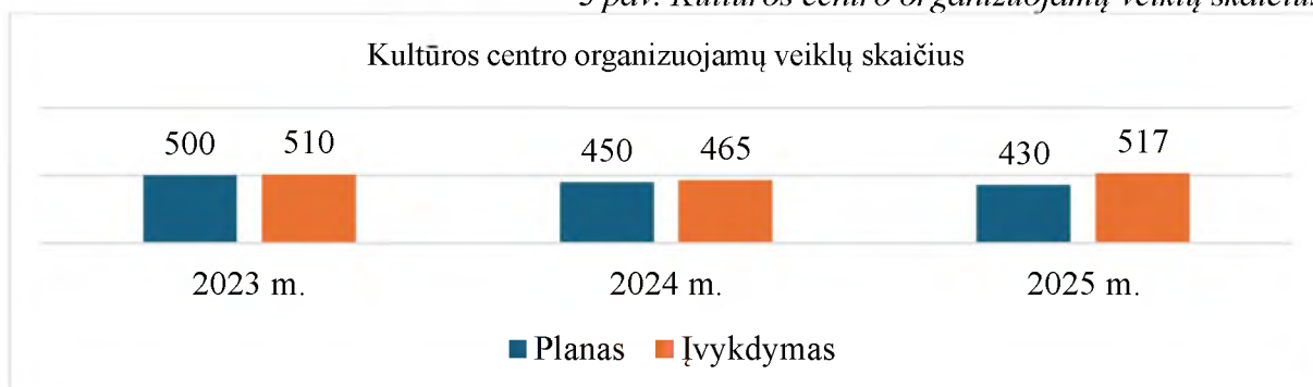
3 pav. Kultūros centro organizuojamų veiklų skaičius

Ataskaitiniam laikotarpiui Kultūros centro veiklos plane buvo nustatyti programos įgyvendinimo rezultatai įvykdyti: